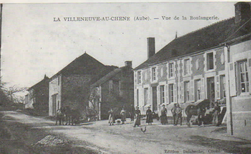
LA VILLENEUVE-AU-CHENE (Aube). — Vue de la Boulangerie.