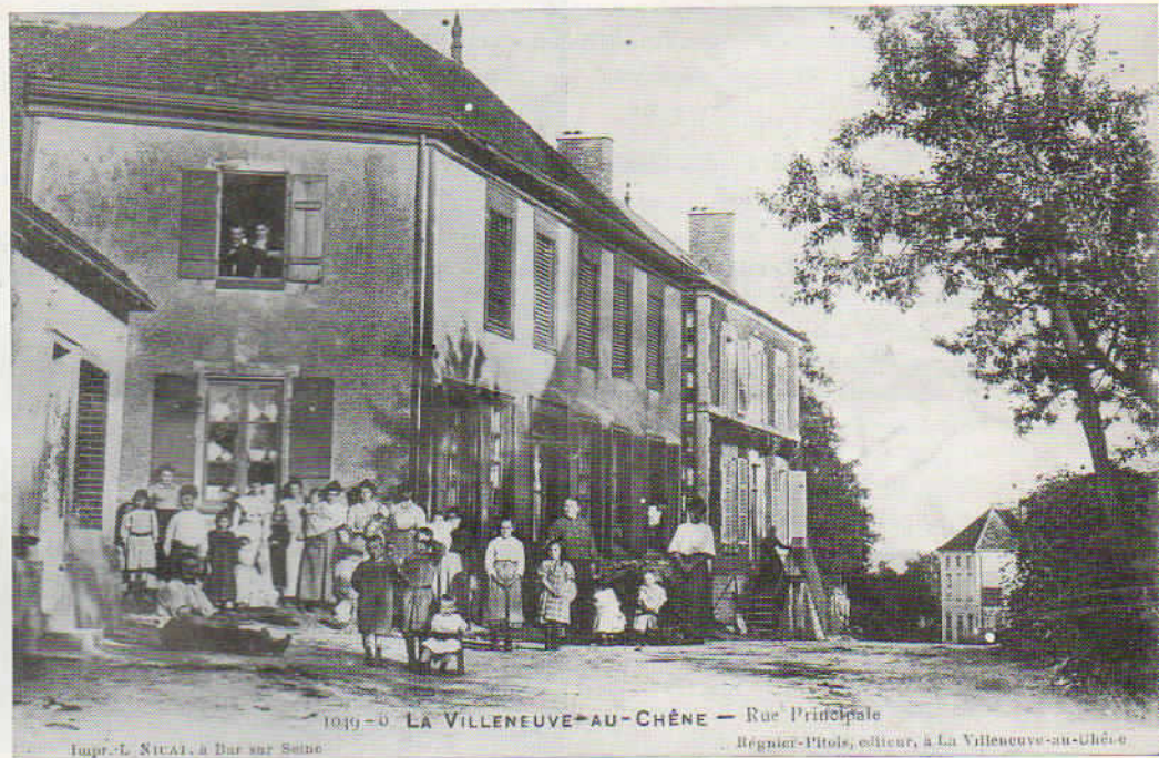
1049-0 LA VILLENEUVE-AU-CHÊNE - Rue Principale