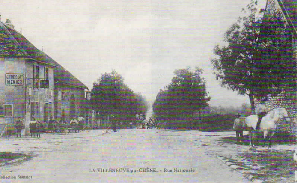
LA VILLENEUVE-au-CHÊNE. - Rue Nationale