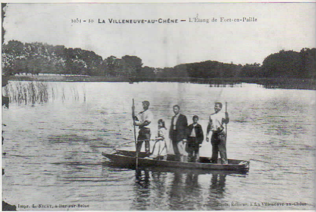
Impr. Le NICAT, à Bar-sur-Seine