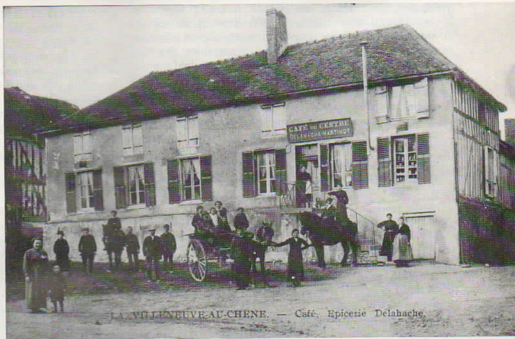
LA VILLENEUVE-AU-CHENE. — Café, Epicerie Delahache