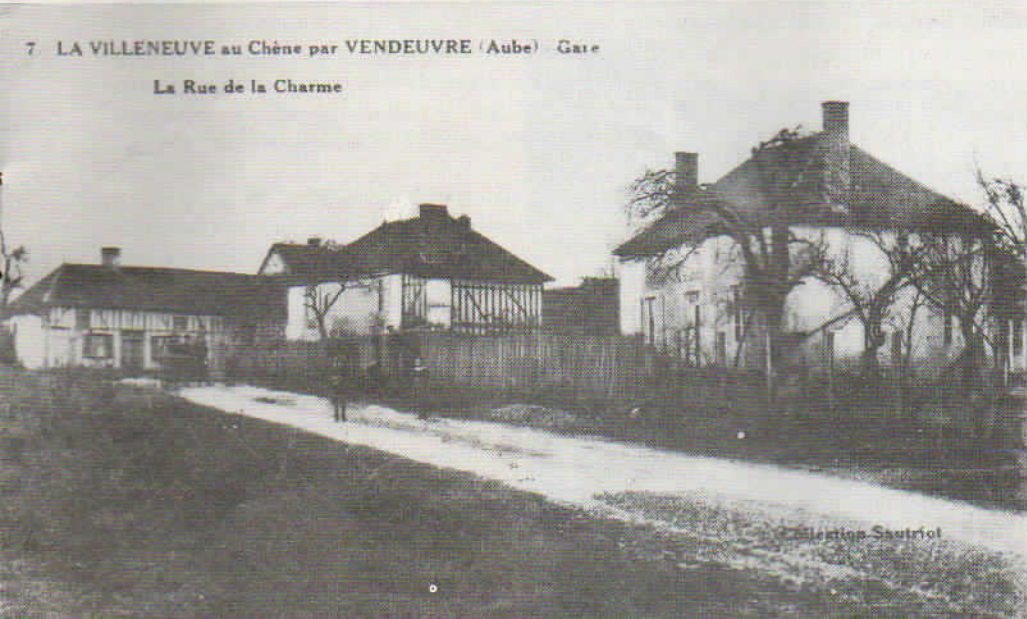
La Rue de la Charme